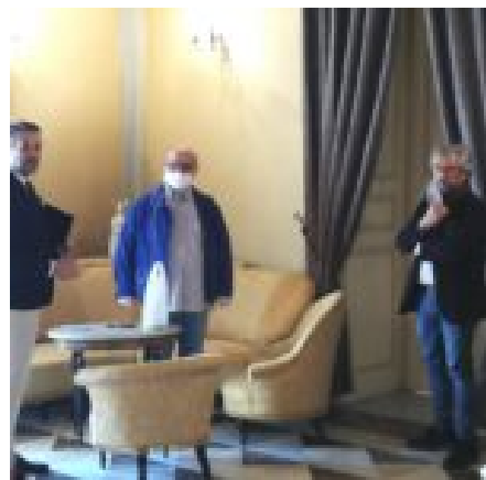
Comitato Confcommercio-Fipe incontra il sindaco, consegnate le chiavi delle attività