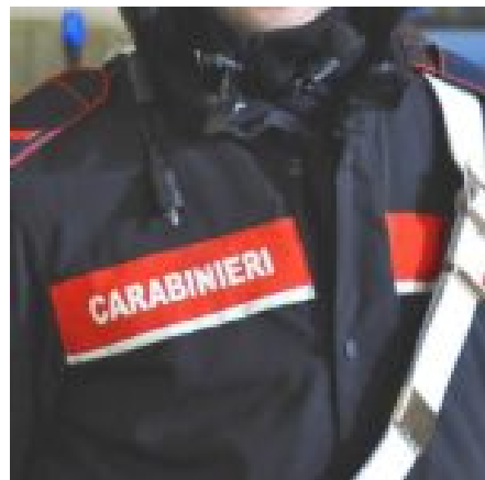
I carabinieri di Caltanissetta consegnano tablet a una studentessa di Delia. “Adesso potrà seguire le lezioni online”